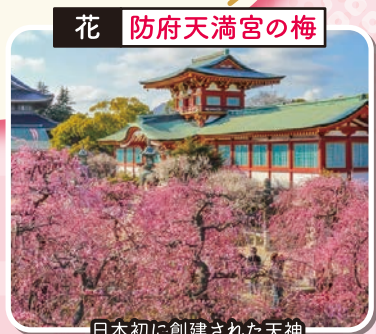
花 防府天満宮の梅

日本初に創建された天神境内は約16種類1100本の梅樹が咲き梅の香りに包まれます