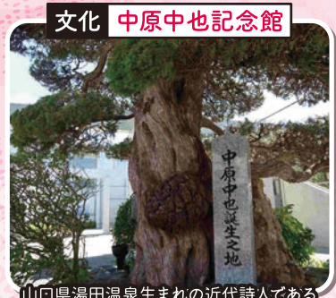
文化 中原中也記念館

山口県湯田温泉生まれの近代詩人である中原中也の自筆や草稿、日記などの貴重な資料が公開されています