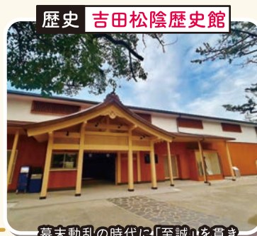
歴史 吉田松陰歴史館

世界遺産 江戸時代の町並みが残る道で美しい白壁となまこ壁は萩らしい風情が感じられます