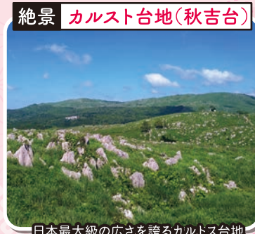
絶景 カルスト台地(秋吉台)